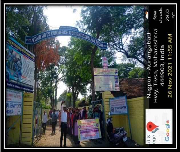
Voter Registration Awareness Campaign-25th November 2021.