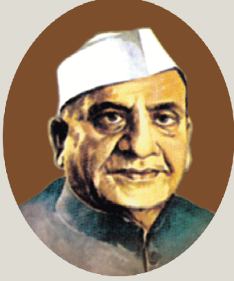
शिक्षणमहर्षी डॉ. पंजाबराव उपाख्य भाऊसाहेब देशमुख

श्री शिवाजी शिक्षण संस्थेचे संस्थापक अध्यक्ष व माजी कृषी मंत्री